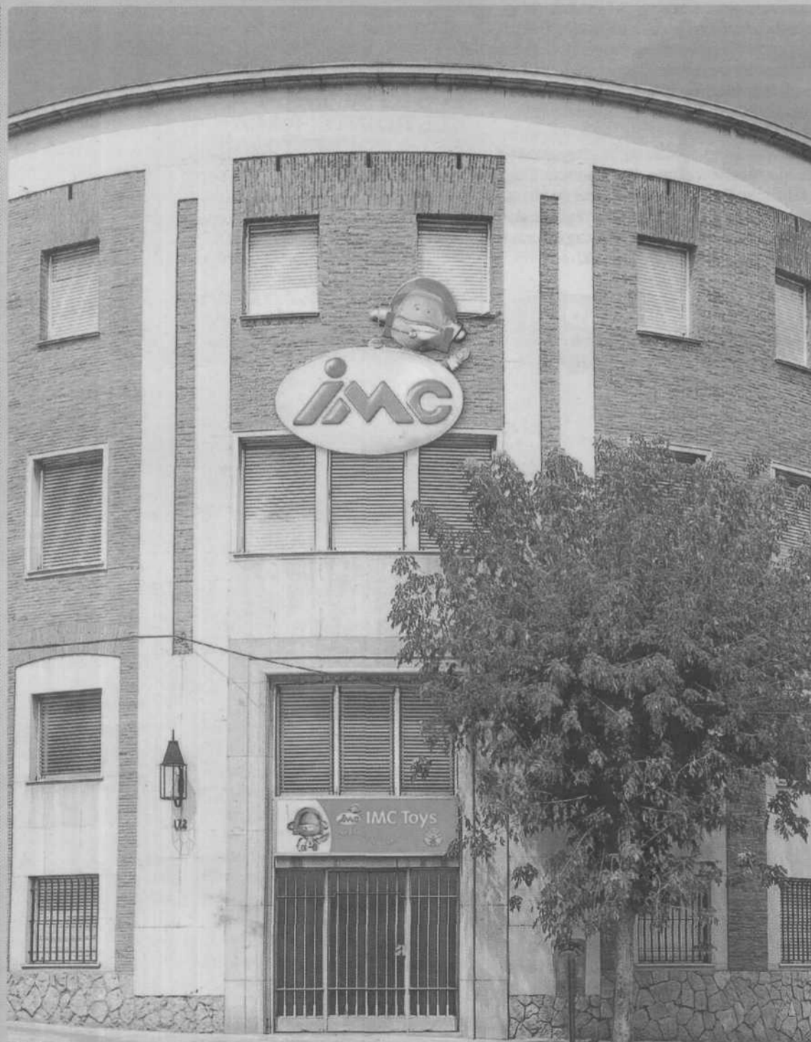
1/// FAÇANA DE L'EMPRESA DE JOGUINES IMC TOYS, UBICADA A TERRASSA, QUE HA OBTINGUT EL RECONeixEMENT A L'EMPRESA MÉS INTERNACIONAL